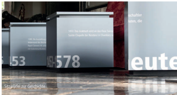
Sitzwürfel zur Geschichte