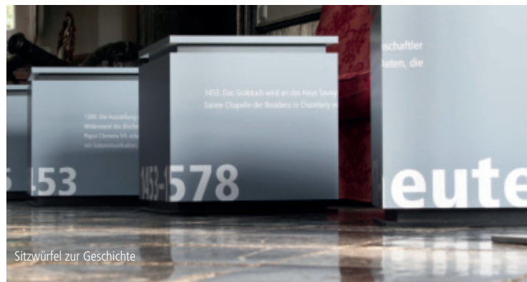
Sitzwürfel zur Geschichte