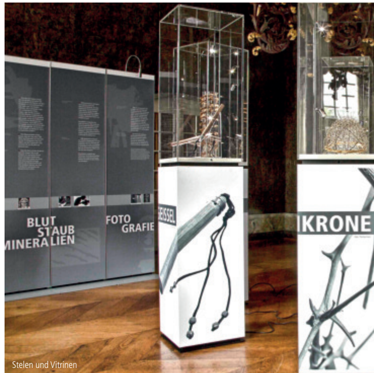
Stelen und Vitrinen